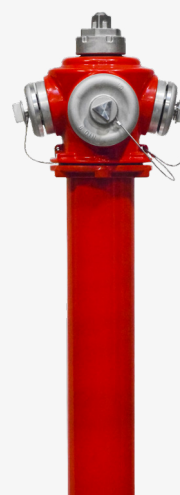
barvano jeklo (3)