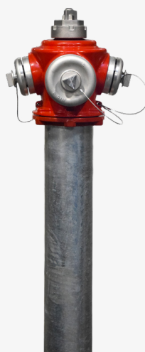
vroče cinkano jeklo (2)