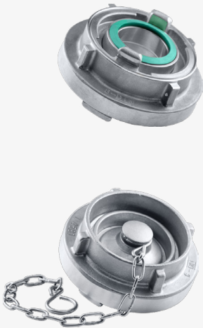
nerjavno jekla (1)