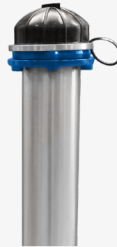
drugi standardi (3)