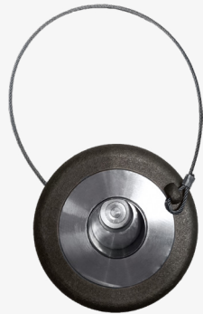
varnostni zaklep (2)